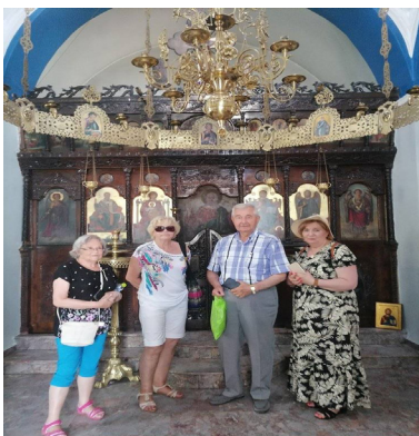
Nasi seniorzy na wycieczce w Grecji