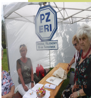
Festyn w Parku Bródnowskim

Zapraszamy jak co roku na nasze letnie koncerty. 17, 24 lipca i 7, 14, 21, 28 sierpnia w Parku Bródnowskim o godz.17.