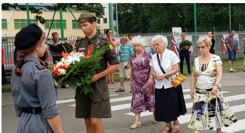
1 08 2020 przy Reducie Bródnowskiej kwiaty składają koleżanki z Oddziału Targówek PZERiI