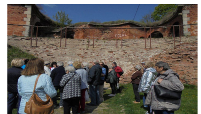
Wycieczka Koła nr 4 do Modlina