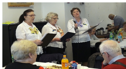
Uroczystości w Kole nr3