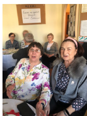
Wielkanoc Koła nr 14