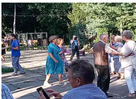
Zdjęcia z zabawy w Arthouse Kołowa 18 12 sierpnia 2021 r.