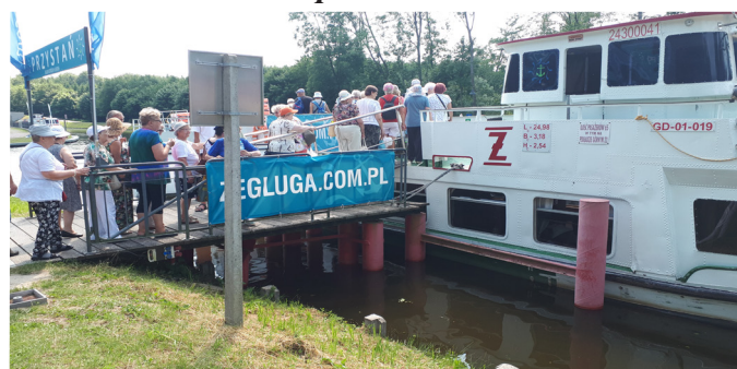
Podróż do Elbląga.