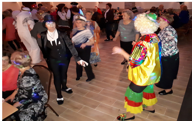
Zabawa, przebieranki w Kole nr 3