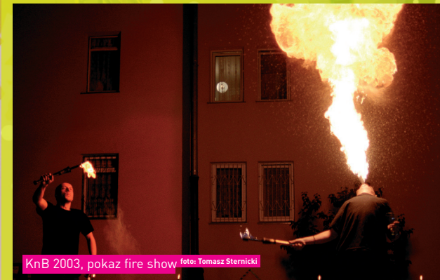
KnB 2003, pokaz fire show

Święta to również nastrój sylwestrowy. I dlatego zaprosiliśmy Pracownię Cyrkową , która zaprezentuje pokaz fire show czyli odbędzie się na żywo taniec z ogniem.