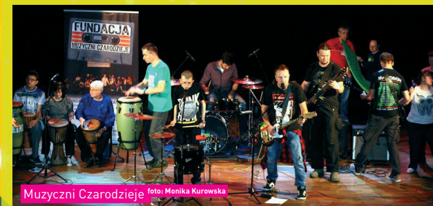
Muzycni Czarodzieje

Zespół Muzycni Czarodzieje powstał w 2010 roku i działa w Środowiskowym Domu Samopomocy „Na Targówku” przy ul. Suwalskiej 11. Od 2014 roku gramy w poszerzonym składzie. Do zespołu dołączyły osoby z ośrodków przy Wilczej