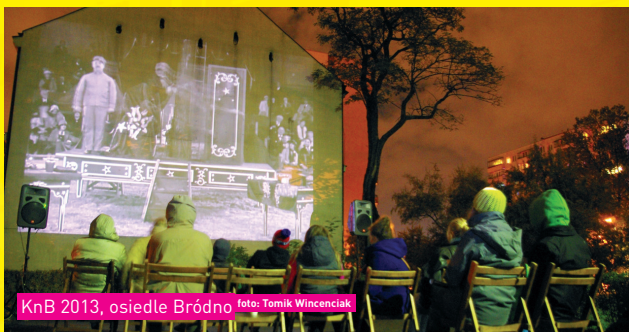
KnB 2013, osiedle Bródno

„Świąteczne Kino na B(l)oku” to kolejna edycja autorskiego projektu Pawła Sky’a – „Kino na B(l)oku”. Dotychczas odbyło się 7 seansów podczas 5 edycji (ul. Św. Hieronima – 2003, ul. Nieszawska – 2012, 2013, 2014 oraz „Kino na Kamienicy – Festyn Sąsiedzki” przy Cafe Sąsiad na Targówku Fabrycznym – 2016).