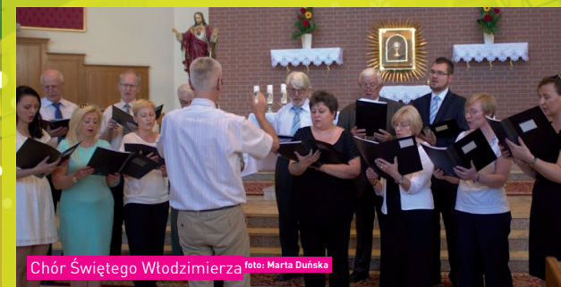
Chór Świętego Włodzimierza

i Rydygiera. Osoby niepełnosprawne intelektualnie śpiewają oraz grają na instrumentach perkusyjnych. Za pozostałe instrumenty „chwytają” terapeuci oraz przyjaciele współpracujący z zespołem.