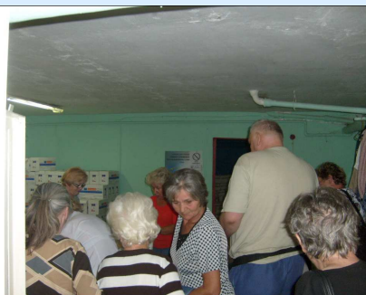
Trwa akcja żywnościowa. A w magazynie stale tłok.