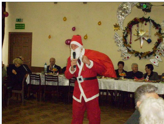
Do dzieci występujących z Jasełką zbliża się Mikołaj. Za chwilę będzie rozdawał słodycze

Działania socjalno – bytowe w zakresie pozyskania i rozprowadzenia żywności w 2009 roku to ponad 140 ton różnych podstawowych produktów, takich jak mleko, sery, makarony, dzemy, cukier, itp... Tę akcję możemy realizować dzięki Radzie i Administracji Osiedla „Kondratowicza” i SM „Bródno” użyczających nam pomieszczenia magazynowe, Otrzymałiśmy pomieszczenie, w którym urządzana jest sala komputerowa, pracownia plastyczna oraz siedziba Zarządu Koła Nr 3.