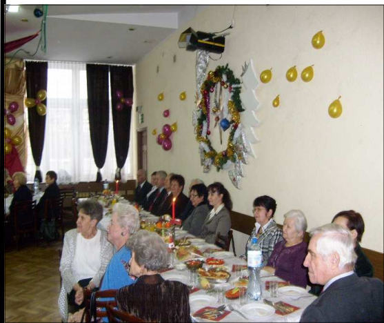
Spotkanie Wigilijne Zarządu 15 12 2009