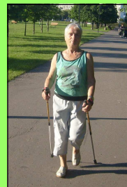
Codzienny spacer z kijkami

Od syna dostałam kijki i się zaczęło. Krok po krocisku, nieśmiało. Zaczęło się to na wczesnych rehabilitacyjnych w Unieściu. Ukończyłam kurs Nordic Walking. Dowiedziałam się, że taki marsz angażuje 90% mięśni. Dzięki ruchom naprzemiennym ramion ciężko pracuje górna część ciała. Taki marsz usuwa sztywność karku i barków. To są same korzyści w starszym wieku. Opieranie się na kijkach odciąża stawy. Chodzenie przy kijkach mogą uprawiać wszyscy, poza osobami z urazami ortopedycznymi i gorączką. Nordic przyspiesza pracę serca i obniża poziom cukru i cholesterolu. Same cuda. Nie jest to trudne. Moje chodzenie trwa 2 lata. Chodzę prawie co dzień, często w złą pogodę, za to odpowiednio ubrana. Badania wykazały, że wyniki lekarskie się poprawiły, choroba zaczęła się cofać. Mam dużo energii. Poznałam na trasie wielu znajomych. Czuję się młodo i rześko.