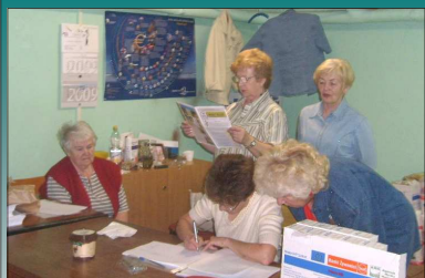
FOTO KRONIKA - z życia seniora