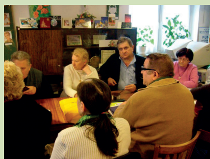
Zebrań Przewodniczących Kół w lokalu Zarządu O/R