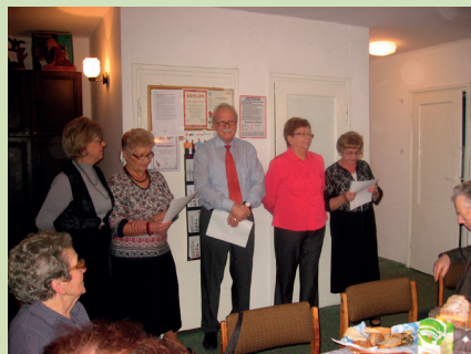
Dzień Babci w Kole nr 4