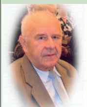
śp. J. Pecura

Następnie podane zostały komunikaty na temat turnusów wypoczynkowych i rehabilitacyjnych nad morzem w ośrodku „Floryn”, Przewodniczący podziękował wszystkim uczestniczącym w spotkaniu i zakończył je życzeniami zdrowia i wszelkiej pomyślności.