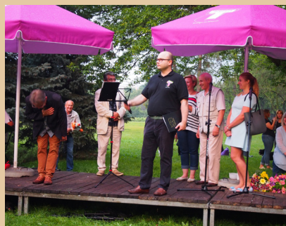
Tradycyjna impreza Pożegnanie lata 2017 okazała się kolejnym sukcesem mimo chwilowego deszczu i trudności organizacyjnych.

Środowisko seniorów licznie uczestniczy w uroczystościach przy Reducie Bródnowskiej poświęconych pamięci bohaterów Powstania Warszawskiego z praskiej części Warszawy. Fragment uroczystości 1 08 2017r.