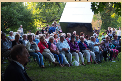
Dziękujemy władzom Dzielnicy za piękny cykl wakacyjnych koncertów plenerowych w Parku Bródnowskim