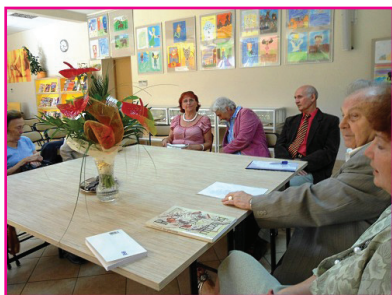
Grupa poetycka w Bibliotece nr 1

Biuletyn Zarządu Oddziału Rejonowego Warszawa Targówek